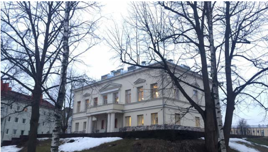
ICOMOSin Suomen osaston vuosikokous pidettiin Koneen säätiön tiloissa Lauttasaaren kartanossa.