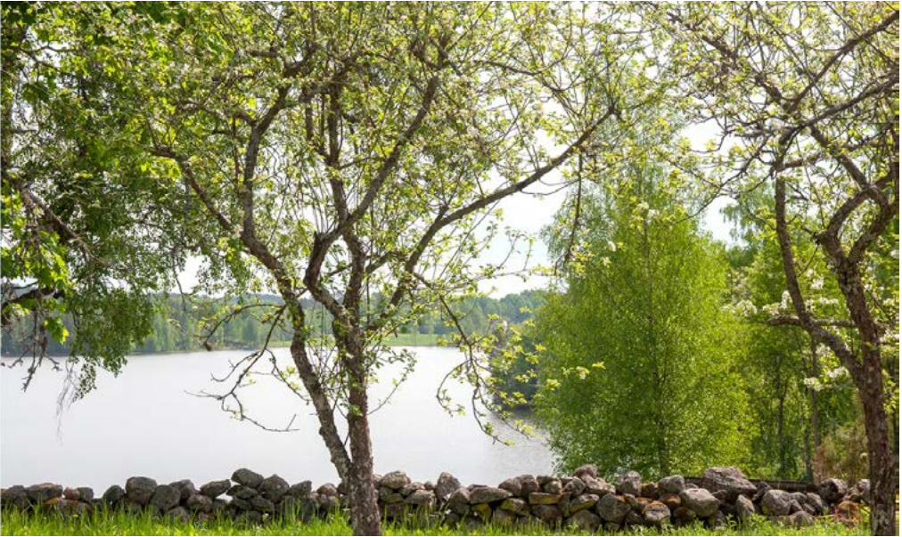
Paikkari omenapuun alta järvelle.